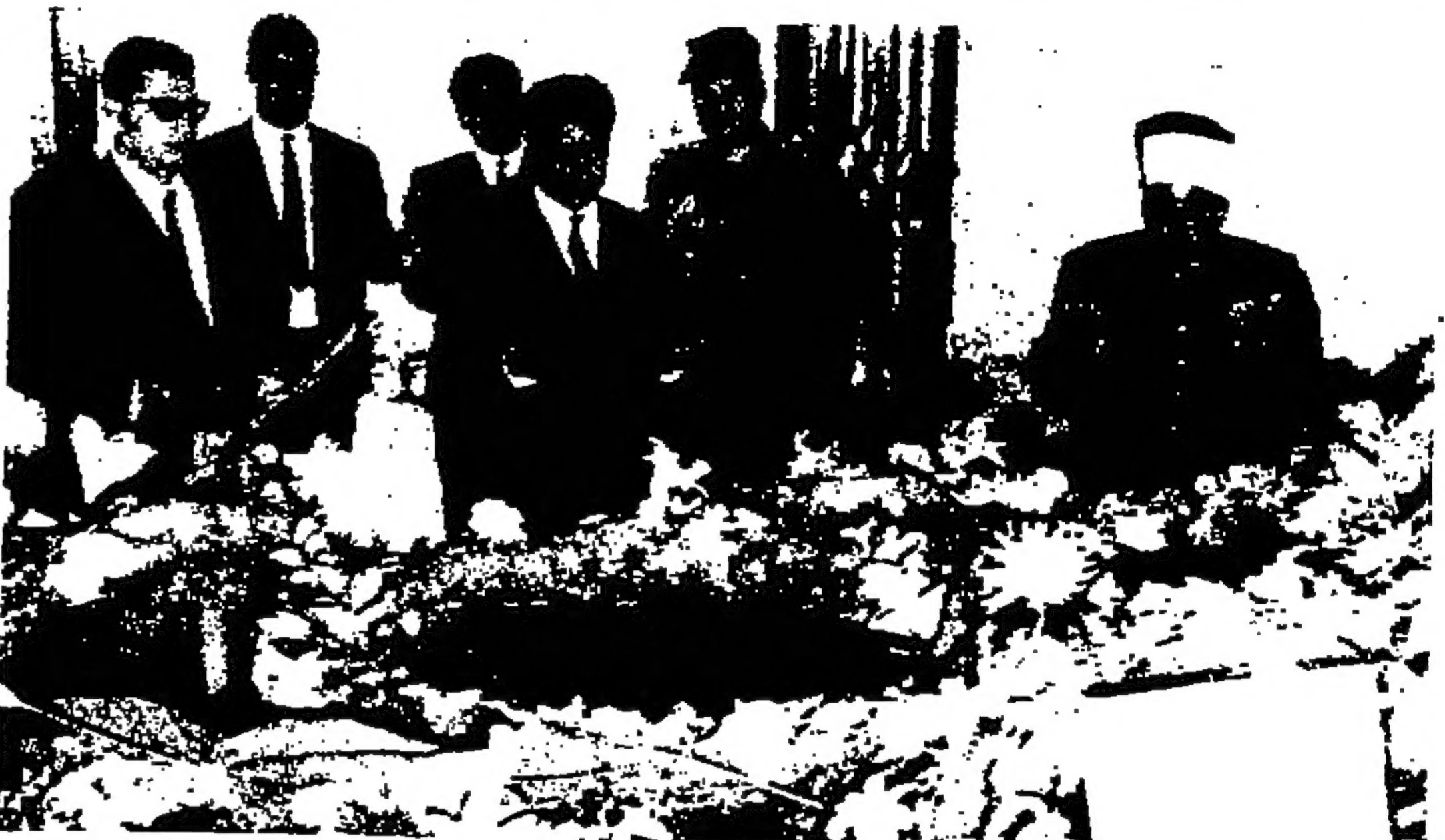
السيد محضى المنفي سكر السودان الجديد بنو الفتحه على روح المغفورله الملك عبد الله المعظم اثناء زيارته لفرنج مؤسس المملكة امس

لندن - رويتر - ركب قس الجيبي في الكاتبة والسبعين من عمره وفشل اقام عشرة اطفال ملونين خلال قداس القمص . وقال القس جاك بوتزل فسرنا عمله هذا في كتيبه في قرية تكستد التي الشمال الغربي من هنا قد كان لا بد من القيام بعمل رمزي للامراب عن الاسي لولة الدكتور مارتن لوتر كينغ .